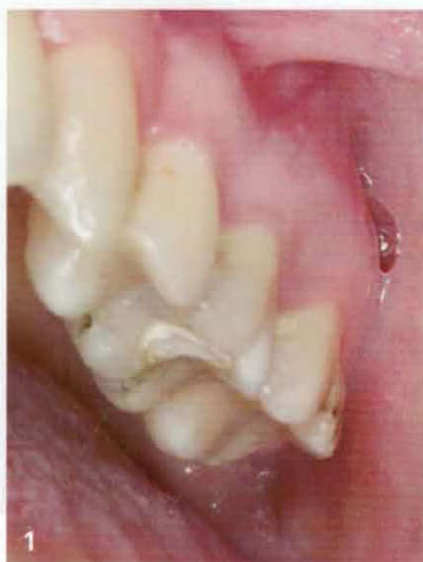
Ausgangssituation Zahn 26 mit infauster endodontischer Prognose und Längsfraktur

Bei Untersuchung des Zahnes 26 konnte eine, den ganzen Zahn umläufig umspannende, Frakturlinie zwischen der palatinalen und den vestibulären Wurzeln unter Lupenvergrößerung festgestellt werden. Da die Patientin keinen körperfremden Knochenersatz und den Lückenschluss über ein Implantat wünschte, wurde sich für die Nutzung des extrahierten Zahnes für das Smart Grinder-Verfahren in einem zweizeitigen Verfahren entschieden.