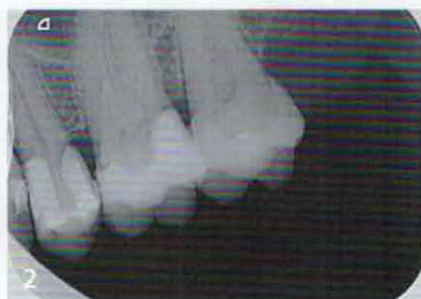
Radiologische Ausgangssituation Zahn 26