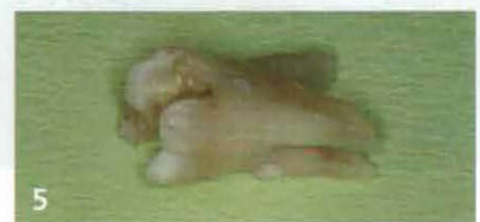
Zustand nach mechanischer Vorreinigung und Entfernung aller dem Zahn anhaftender Fremdkörper