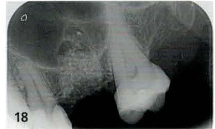
Postoperative Röntgenkontrolle mit Aufbau in Situ