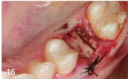
Verhinderung der Mobilisation des Aufbaus durch zwei liegende horizontale Matrizennähte