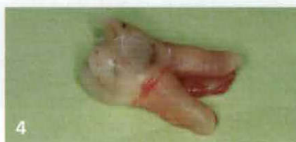
Extrahierter Zahn vor mechanischer Reinigung