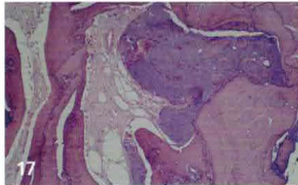
Histologie des Knochen-Dentin-Interface