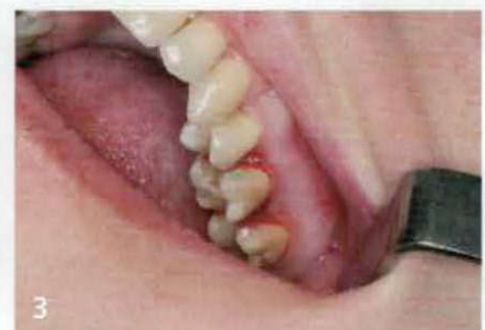
Lösen des parodontalen Halteapparats