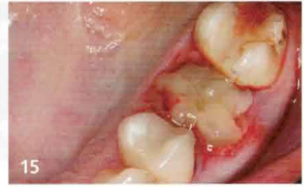
Verschluss der Extraktionsalveole mit A-PRF