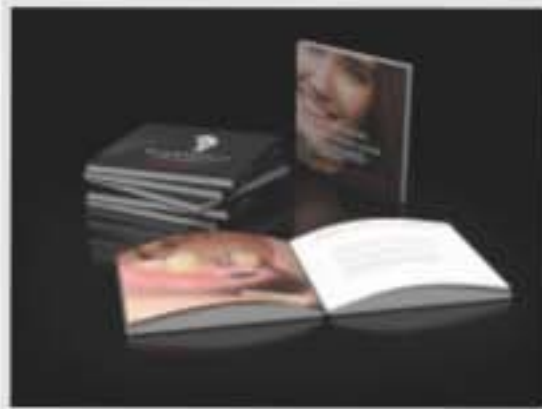
Das Wartezimmer-Buch zeigt, was moderne Zahnmedizin leistet

moderne Zahnmedizin gibt Ihnen Ihr Lachen zurück